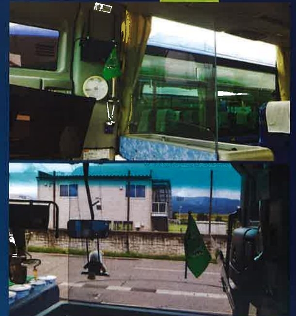
【視界を遮らない飛沫対策ボード】全車両装着